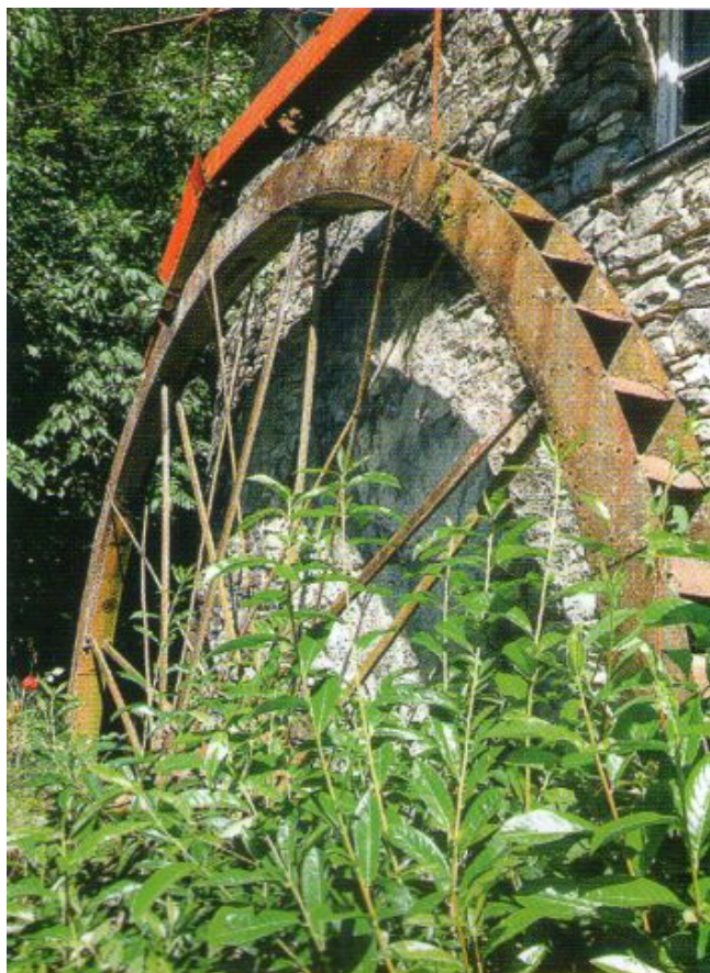
la ruota del Mulino

Mercoledì 05 Novembre 2014 13:57 - Ultimo aggiornamento Mercoledì 05 Novembre 2014 14:05