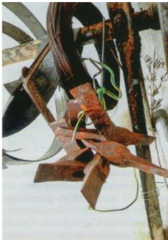
I martelli utilizzati da Luciano Margari e prima ancora dal padre, per molare le pietre dei mulini.

Mercoledì 05 Novembre 2014 13:57 - Ultimo aggiornamento Mercoledì 05 Novembre 2014 14:05