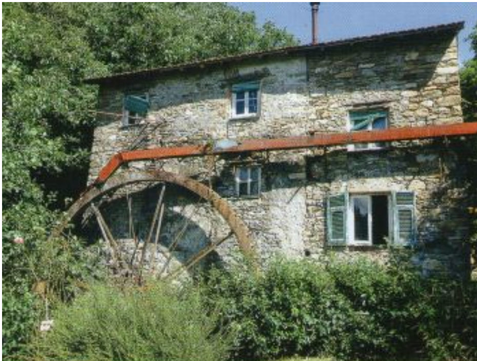
Il Mulino di Zane.

Mercoledì 05 Novembre 2014 13:57 - Ultimo aggiornamento Mercoledì 05 Novembre 2014 14:05