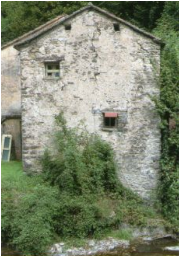
Il Mulino di Rasciou.

Mercoledì 05 Novembre 2014 13:57 - Ultimo aggiornamento Mercoledì 05 Novembre 2014 14:05